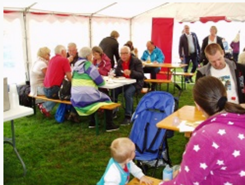
Sankt Hans 2016

Trods regnvejr havde vi for 3. gang en rigtig god og hyggelig Sankt Hans arrangement på Skjern Å camping.