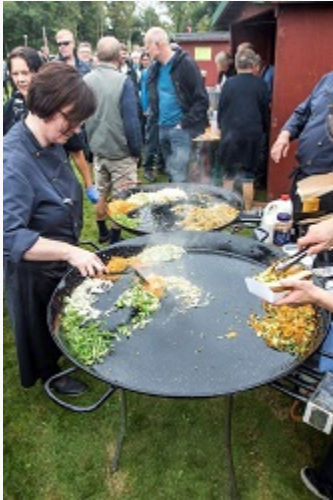
Efterfølgende var der fadøl, og gourmet hotdog fra "Kulinarisk Vestjylland"