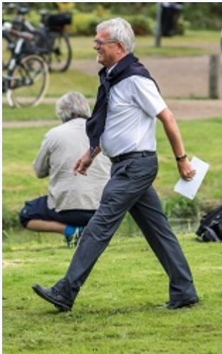
Der var en glad Borgmester