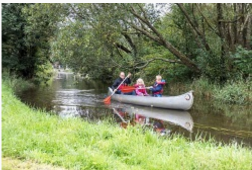
Sejlads på Kirke Å i Urskoven