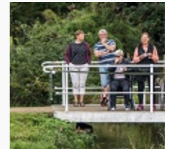
Der var trængsel