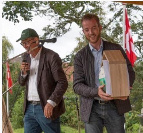
Der var en glad Minister, nu med Fuglehus signeret af alle Skjern Håndbolds spillere