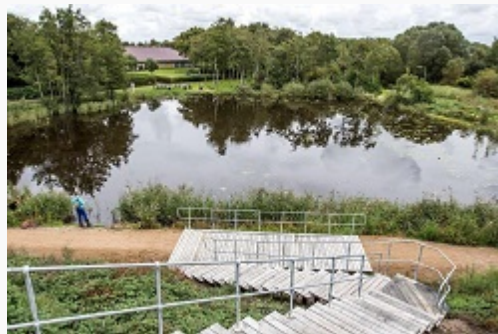
Her Byrummet Urskoven med den smukke fiskesø set fra toppen af kælkebakken.